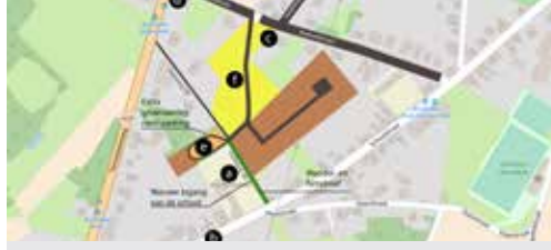
Baekveldwijk in Bunsbeek (p. 2)